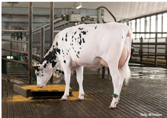
STANTONS PURSUIT OF JUSTICE