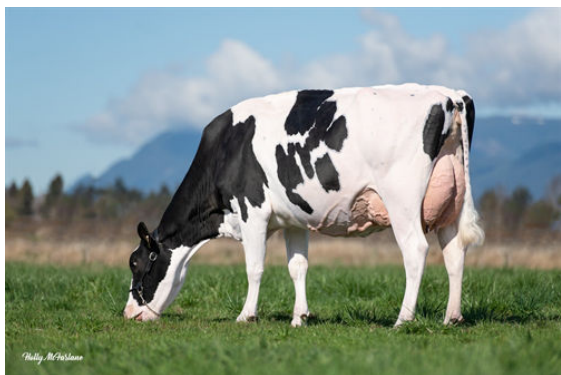
WESTCOAST PSUIT LAUMAB 8996