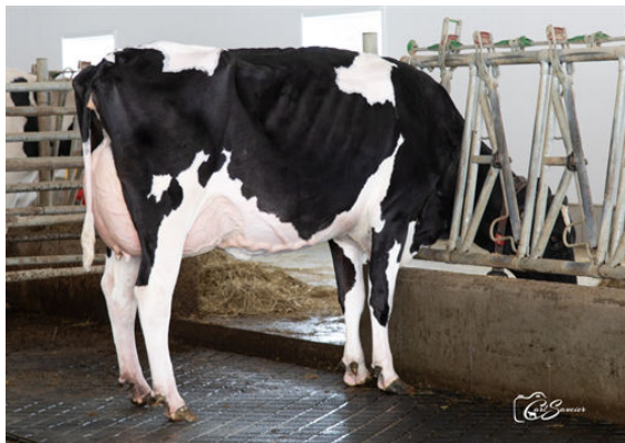
PROGENESIS PURSUIT DIETIES